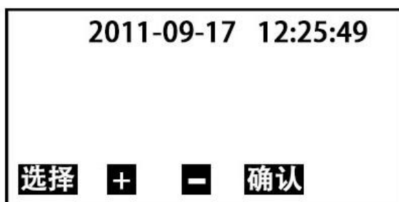
图 4 时间设置子页面

按 选择 键移动光标一至年、月、日、时、分处，按 + 或 - 键选择具体数值后，按 确认 键确认，并返回开机页面；