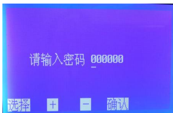
图 6 数据标定子界面

注意：设备出厂前数据已由厂家标定好，用户不需要进入程序标定，如需要标定数据，请与生产厂家联系索要密码进行标定。