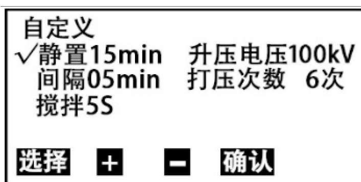
图 5 自定义设置子页面

在图 5 页面下，按 选择 键移动光标到相应的选项，再按 + 或 - 键可进行相关参数的设置。其中：