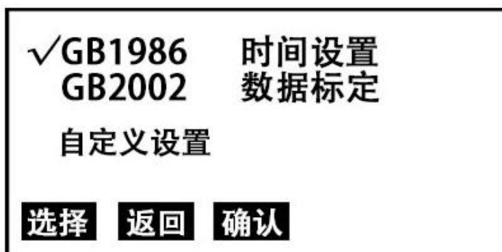
图 2 选择子页面

3. 在图 2 页面下，按 选择 键移动光标 √ 至 GB1986 处，按 确认 键即可进入国标 1986 设置子页面（图 3）。