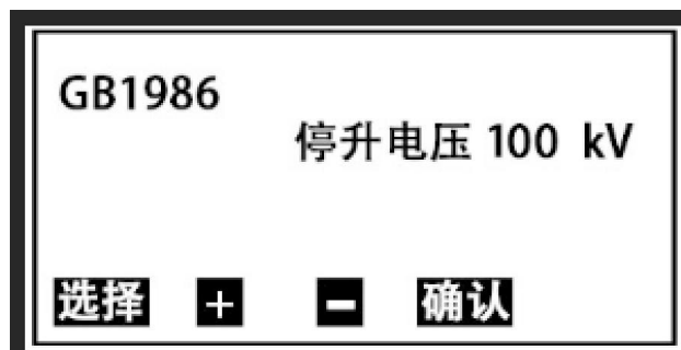
图 3 GB1986 子页面

3. 在图 2 页面下，按 选择 键移动光标 √ 至 GB1986 处，按 确认 键即可进入国标 1986 设置子页面（图 3）。