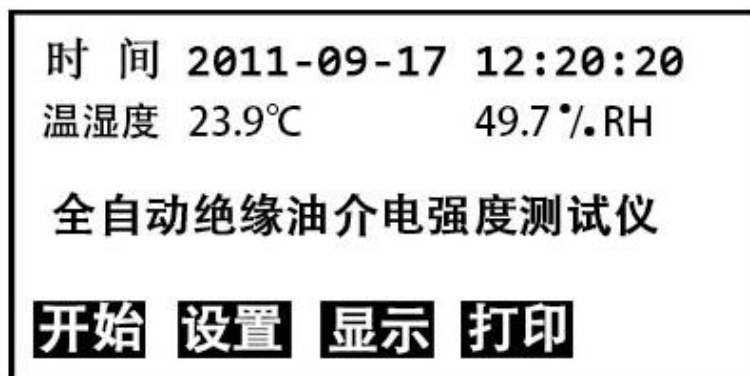
图 1 开机页面