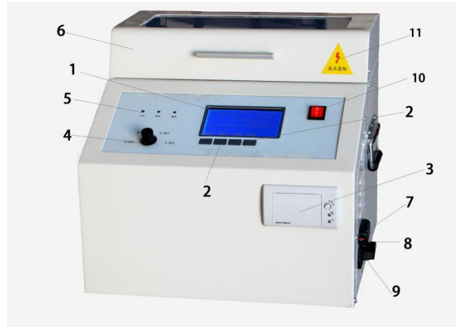
YTC3601 绝缘油介电强度测试仪